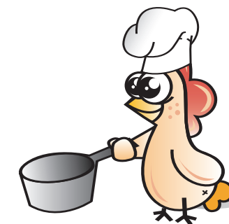
ILLUSTRAZIONE E. PETERMAN

La Camera di commercio di Cuneo segue con grande attenzione