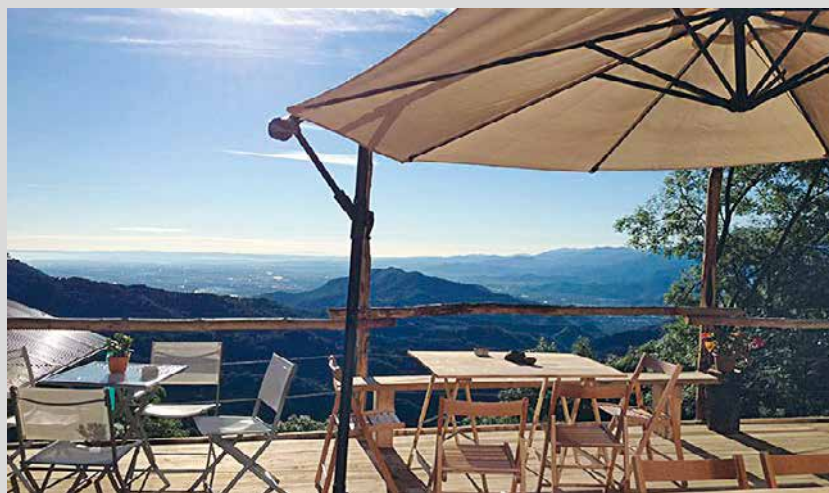
Sarà la borgata Paraloup, nel comune di Rittana in bassa valle Stura, ad ospitare il tradizionale concerto di Ferragosto dell'Orchestra Bruni.