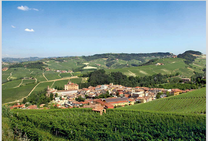
Barolo – Archivio Ente Turismo Alba Langhe e Roero. Fotografia di copertina della Guida all'ospitalità italiana di qualità 2015 (articolo a pag. 15)